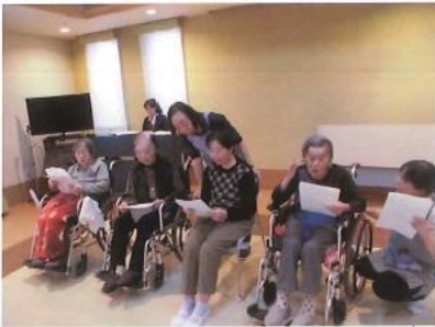
コーラス部による合唱を披露しました。 とても心地の良い歌声でした。