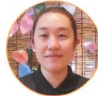
4/15 なつば あじさい