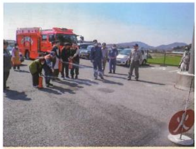
消火器の訓練に職員含め 一生懸命取り組まれています。