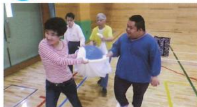
法人内施設と交流。楽しかった～！！