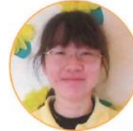
4/1 なつば あじさい

趣味は道の駅巡りです。皆さんのオススメの道の駅を教えてください！よろしくお願ひします。