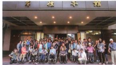
旅館の前で集合写真!!