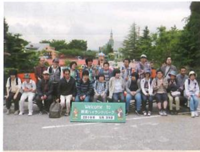
那須ハイランドパークに来ました 晴れてよかったあ