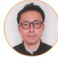
3/1 居宅 あじさい