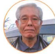
12/20 なつば あじさい