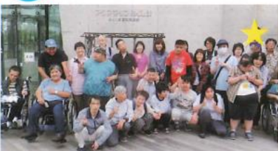
大きな水槽のお魚さん 迫力満点！！