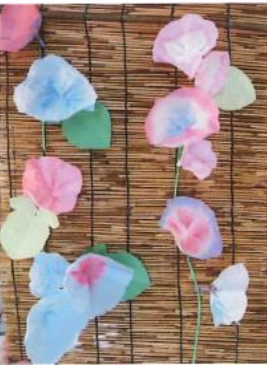
コーヒーフィルターに 絵具をしみ込ませて 利用者様と一緒に 作りました。