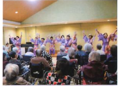
ボランティアによるよさこいを楽しみ、 盛り上がりました。