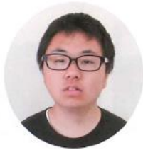
よろしくお願いします。