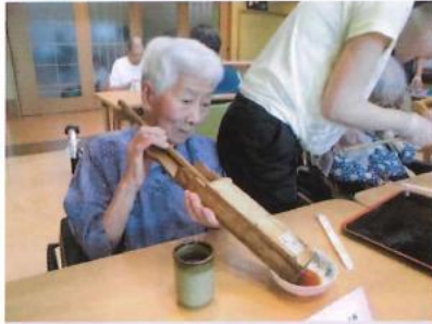
ところてんを召し上がり、初夏を感じました。 冷たくさっぱりして美味しかったです。