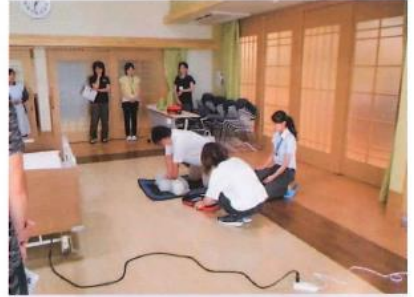
講師を招いて、AEDの使用方法和 心臓マッサージの方法を学びました。