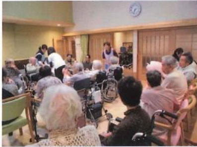
なつぼ・あじさいで 物送りリレーをやりました。