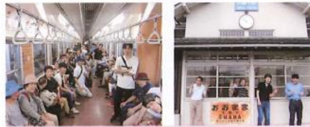
駅と渓谷鉄道の車内にてハイポーズ!!