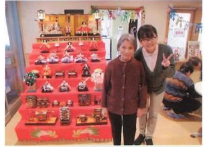
ひな祭りを皆様と一緒に行いました。