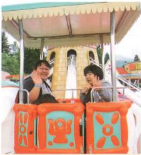
しゅっぱつ☆ 利用者様の笑顔がたくさんみられました