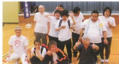
今年も楽しんで参加してきました。