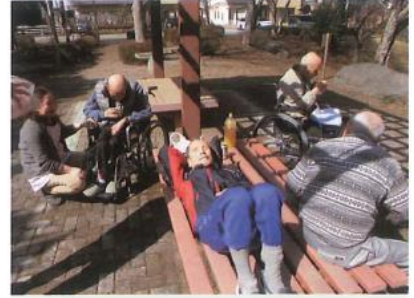
お花見外出で近隣散策へ行きました。 お日柄もよく愉しむ事ができました。