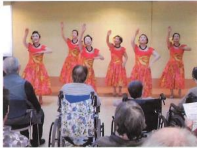
シェアリング・フラ様により 素敵なフラダンスを披露していただきました。