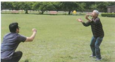
ボール遊び 上手に出来たよ！