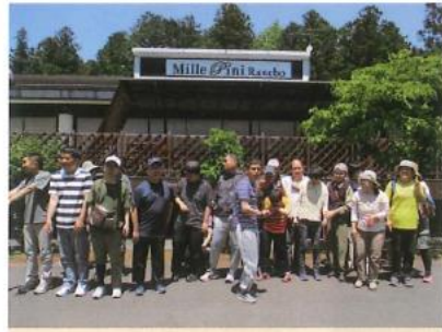
今年は千本松牧場へ キャンドル作りなど楽しみました。