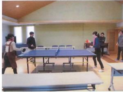
なつぼのふれあいホールに 念願の卓球台が導入されました。