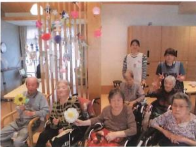
七夕の飾りつけを皆で協力し行いました。