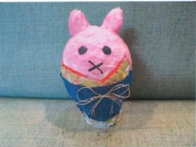
利用者様作品のウサギの張り子