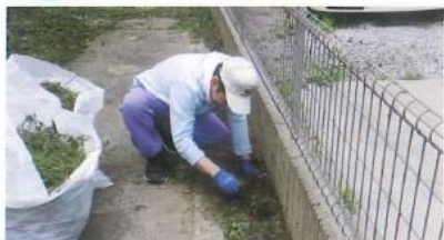
お仕事も頑張っています。