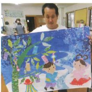
みんなで作ったよ！願い事～☆