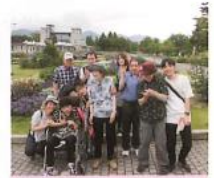
群馬フラワーパーク衆