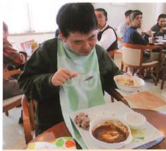
レストラン外食ははじめました 毎月楽しみと好評のようです。